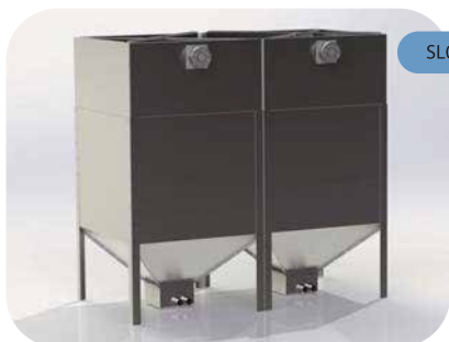
SL003M con kit per carico da autocisterna